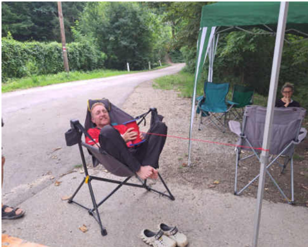
Asterix Gallicus agitat. Asterix Gallicus schaukelt.