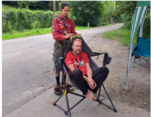
Asterix Gallicus agitur. Asterix Gallicus wird geschaukelt.